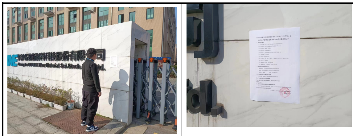
图3-4 征求意见稿公示现场张贴照片

我单位通过现场张贴的方式在湖南冷水江市锡矿山街道谭家支委会进行征求意见稿公示，确保了项目周边居民对该项目的知情权。公示时间为2023年1月10日至报批前，现场张贴照片见图2-5。