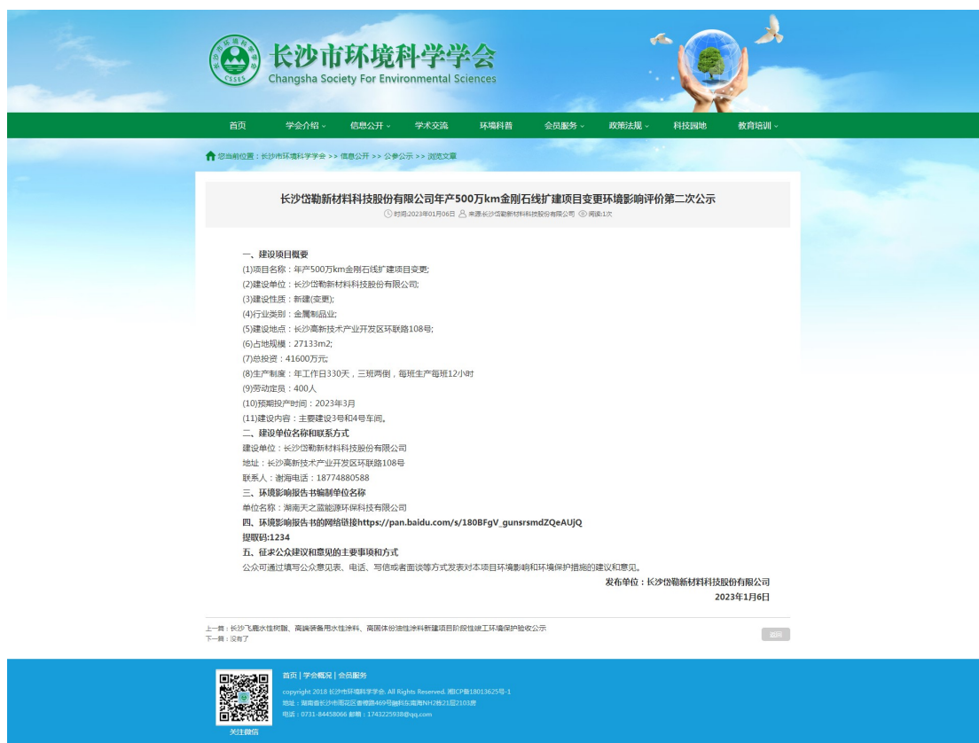
图3-2 征求意见稿公示网络截图