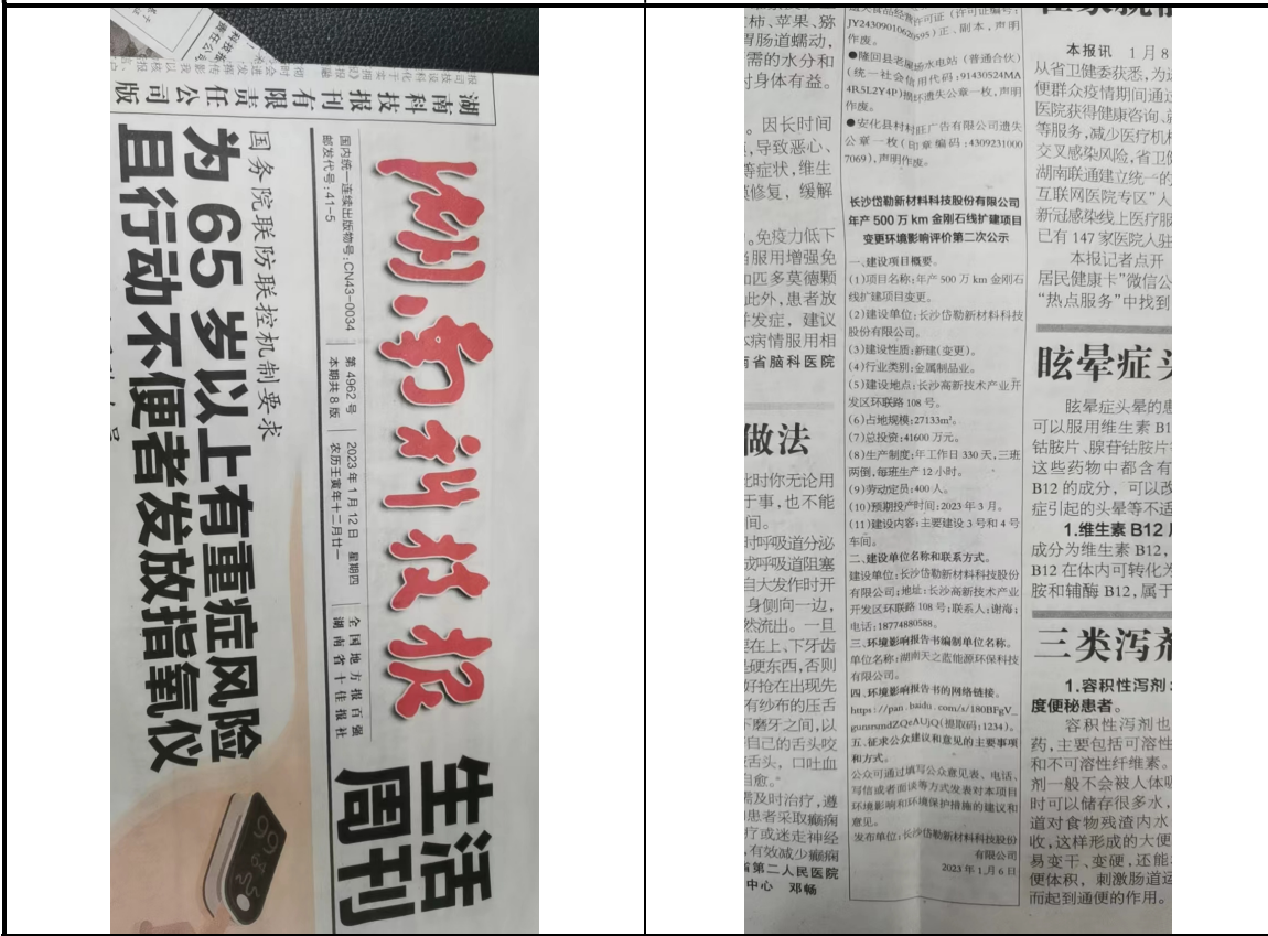
图3-3 征求意见信息公示