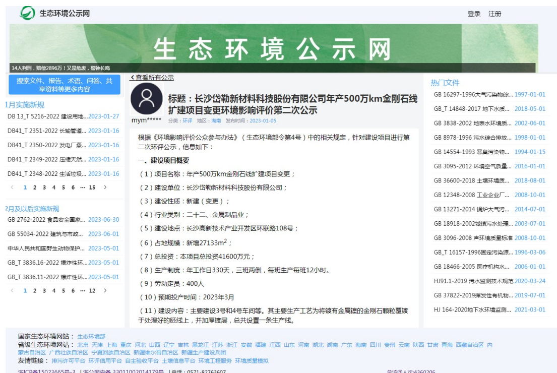
图3-1 征求意见稿公示网络截图

网络公示选择在公共网络生态环境公示网进行公示，网络公示时间为2023年1月6日至报批前，链接 https://gongshi.qsyhbgj.com/h5public-detail?id=321329 ，网络截图见图3-1。除此外，还在长沙市环境科学协会网站进行公示，网络公示时间为2023年1月6日至报批前，链接 http://www.csses.org.cn/xxgk/gcgs/3030.html ，网络截图见图3-2。